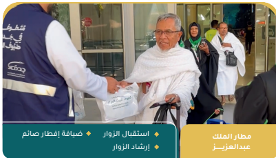
مطار الملك عبدالعزيز استقبال الزوار إرشاد الزوار ضيافة إفطار صائم