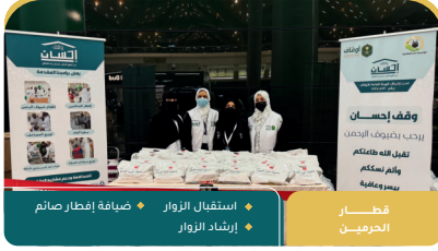
قطار الحرمين استقبال الزوار إرشاد الزوار ضيافة إفطار صائم