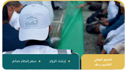
الحرم المكي الشريف استقبال الزوار إرشاد الزوار سفر إفطار صائم