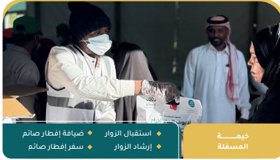
خيمة المصفاة استقبال الزوار إرشاد الزوار ضيافة إفطار صائم سفر إفطار صائم