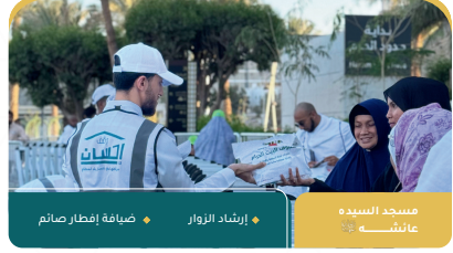
مسجد السيدة عائشة استقبال الزوار إرشاد الزوار ضيافة إفطار صائم