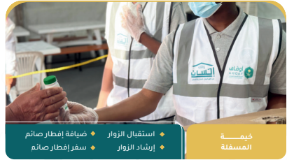
خيمة المصفاة استقبال الزوار إرشاد الزوار ضيافة إفطار صائم سفر إفطار صائم