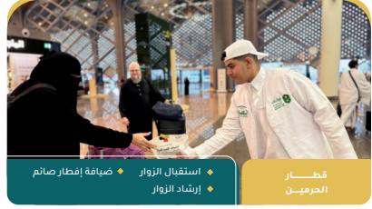
قطار الحرمين استقبال الزوار إرشاد الزوار ضيافة إفطار صائم