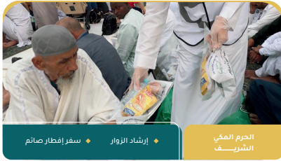
الحرم المكي الشريف استقبال الزوار إرشاد الزوار سفر إفطار صائم